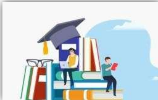
Gambar 1. 1 Pendahuluan Manajemen Pendidikan

Perubahan dalam arti perbaikan yang terus menerus dalam pendidikan pada semua tingkat dan pada setiap bidang keilmuan sebagai antisipasi kepentingan masa depan.