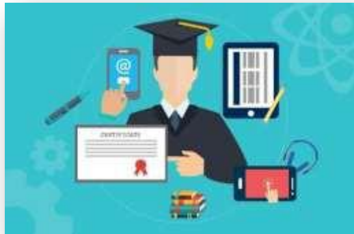
Gambar 3. 1 Ruang Lingkup Manajemen Pendidikan

Pendidikan formal didapatkan pada saat pembelajaran disekolahan sedangkan pendidikan non-formal didapatkan dari kehidupan sehari-hari bisa dari keluarga dan masyarakat.