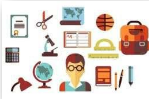
Gambar 4. 1 Manajemen Berbasis Sekolah (MBS)

Manajemen Berbasis Sekolah (MBS) secara umum dapat diartikan sebagai model pengelolaan yang memberikan otonomi (kewenangan dan tanggung jawab) lebih besar kepada sekolah, memberikan fleksibilitas atau keluwesan-keluwesan kepada sekolah, dan mendorong partisipasi secara langsung warga sekolah (guru, siswa, kepala sekolah, karyawan) dan masyarakat (orangtua siswa, tokoh masyarakat, ilmuwan, pengusaha dan sebagainya), untuk meningkatkan mutu sekolah berdasarkan kebijakan pendidikan nasional serta peraturan perundang-undangan yang berlaku. Dengan otonomi tersebut, sekolah diberikan kewenangan dan tanggung jawab untuk mengambil keputusan. sesuai dengan kebutuhan, kemampuan dan tuntutan sekolah serta masyarakat atau stakeholder yang ada.