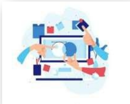
Gambar 5. 1 Perencanaan Sekolah

Implementasi MBS memerlukan seperangkat peraturan dan pedoman-pedoman (guidelines) umum yang dapat dipakai sebagai pedoman dalam perencanaan, monitoring, dan evaluasi, serta laporan pelaksanaan. Rencana sekolah merupakan salah satu perangkat terpenting dalam pengelolaan MBS. Rencana sekolah merupakan perencanaan sekolah untuk jangka waktu tertentu, yang disusun oleh sekolah sendiri bersama dewan sekolah.