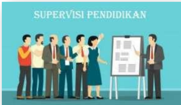
Gambar 9. 1 Supervisi Pendidikan

Teknik supervisi Pendidikan adalah alat yang digunakan oleh supervisor untuk mencapai tujuan supervisi itu sendiri yang pada akhir dapat melakukan perbaikan pengajaran yang sesuai dengan situasi dan kondisi. Dalam pelaksanaan supervisi pendidikan, sebagai supervisor harus mengetahui dan memahami serta melaksanakan teknik-teknik dalam supervisi.