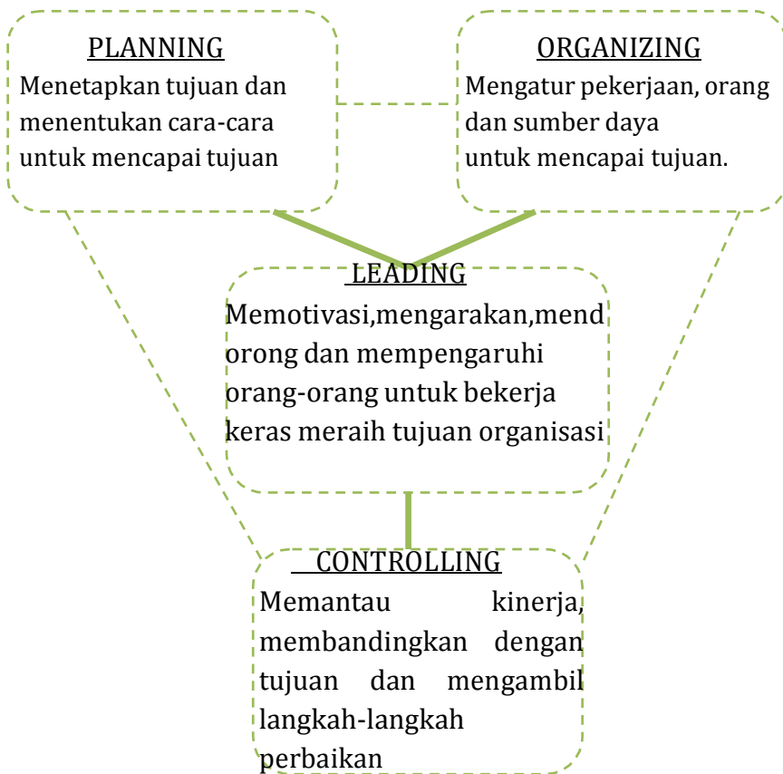
Gambar 2. 2 Fungsi Manajemen Pendidikan

Fungsi manajemen pendidikan adalah elemen-elemen dasar yang akan selalu ada dan melekat di dalam proses manajemen yang akan dijadikan acuan oleh manajer dalam melaksanakan kegiatan pendidikan untuk mencapai tujuan yang efektif dan efisien. Dalam manajemen terdapat fungsi-fungsi manajemen yang terkait erat di dalamnya.