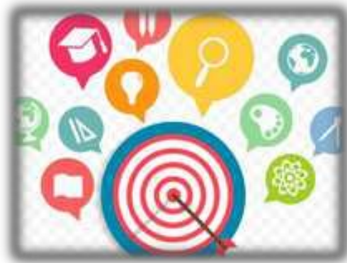
Gambar 1. 2 Tujuan Pendidikan

Tujuan pendidikan adalah menciptakan seseorang yang berkualitas dan berkarakter sehingga memiliki pandangan yang luas kedepan untuk mencapai suatu cita-cita yang diharapkan dan mampu beradaptasi secara cepat dan tepat di dalam berbagai lingkungan. Karena pendidikan itu sendiri memotivasi diri kita untuk lebih baik dalam segala aspek kehidupan.