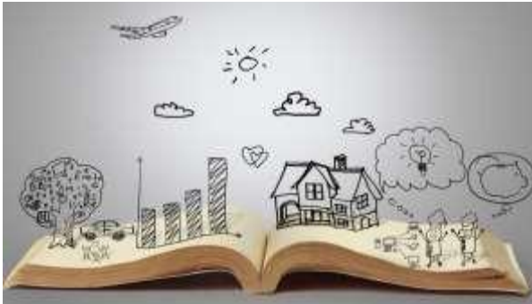
Gambar 2. 1 Pengertian Manajemen Pendidikan

Manajemen Pendidikan adalah suatu proses atau sistem pengelolaan Manajemen Pendidikan sebagai suatu proses atau sistem organisasi dan peningkatan kemanusiaan dalam kaitannya dengan suatu sistem pendidikan.