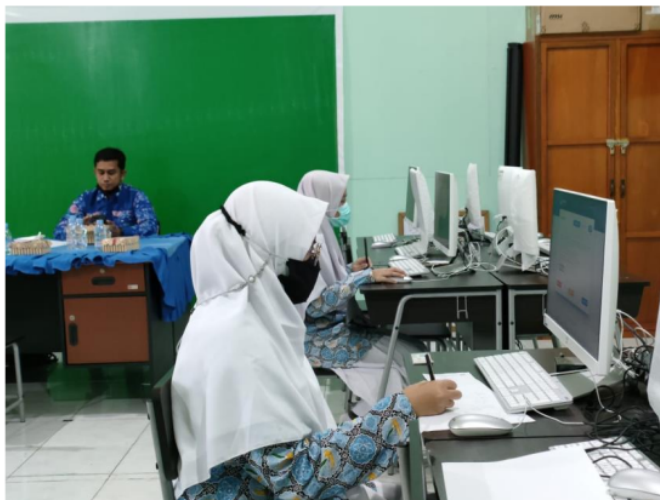
Gambar 2. Pembelajaran guru berbasis Multimedia