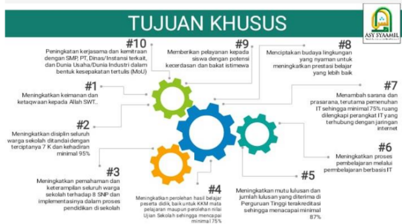
Gambar 1: Tujuan khusus atau tujuan jangka pendek

Dari hasil wawancara di atas, terdapat perencanaan jangka pendek tiga bulan, perencanaan jangka menengah dengan enam bulan dan jangka panjang untuk satu tahun, untuk mendukung data tersebut terdapat data dokumentasi berupa gambar untuk tujuan jangka pendek sebagai berikut: