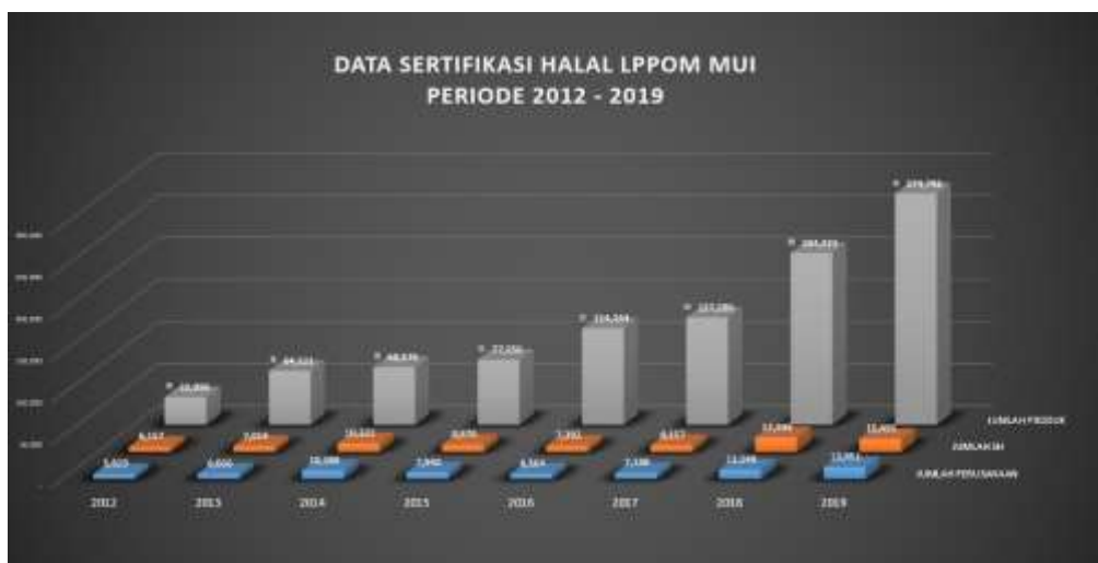
Figure 1. Halal certificate issued by the LPPOM MUI