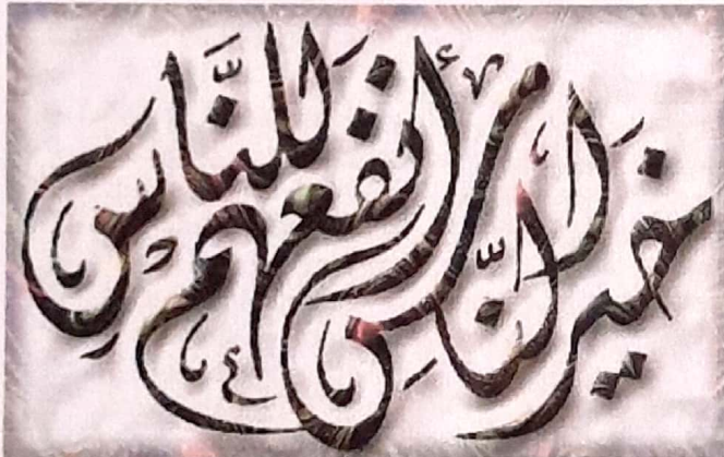
"Sebaik-baik manusia adalah yang bermanfaat untuk oran lainnya"

A. AMATI GAMBAR BERIKUT DAN BERIKAN PENDAPATMU