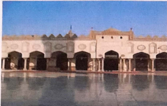
Kampus Universitas Al-Azhar, Kairo, mesir www.id.wikipedia.org