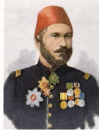
Muhammad Ali Pasya (1769-1849M)

Kontak dengan kebudayaan Barat ini ditambah lagi dengan jatuhnya kekuatan Mesir oleh Napoleon Bonaparte dari Perancis disusul dengan imperialisme barat terhadap negara-negara muslim lainnya, membuka pemikiran pemuka-pemuka intelektual dan pemerintahan Islam Mesir untuk segera mengadakan pembaharuan.