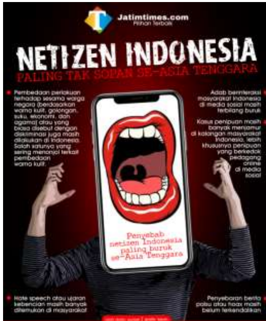
Gambar 1. Pamflet Penyebab Netizen Indonesia paling buruk se-Asia Tenggara

Jika melihat fakta sebelumnya, menunjukkan bahwa indeks literasi Indonesia berada pada urutan bawah dibandingkan negara lain. Ini menunjukkan satu temuan penting bahwa dominasi warga yang terhubung ke Internet dengan kecakapan sebagai netizen berbanding terbalik. Keterampilan tidak didukung dengan pengetahuan terkait dengan teknologi. Pengetahuan ini yang disebut dengan literasi digital. Coba dibayangkan, apa yang terjadi jika semua warga Indonesia terhubung ke Internet, tapi teknologi tidak digunakan sebagaimana mestinya namun untuk tindakan kejahatan. Maka yang dibutuhkan ialah bagaimana literasi digital dapat masuk dalam kurikulum pendidikan di Indonesia.